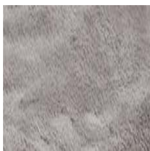
Col. 90 silber