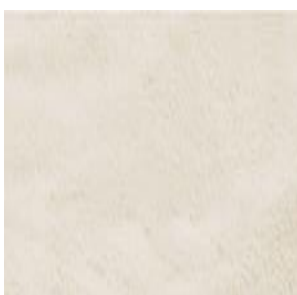
Col. 10 creme