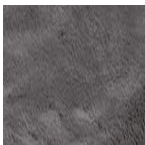
Col. 91 anthrazit