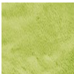
Col. 80 grün