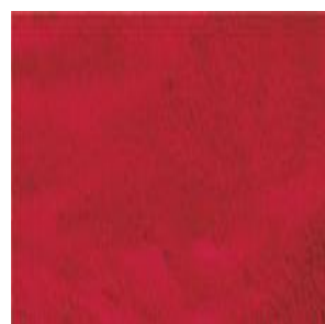
Col. 37 rot