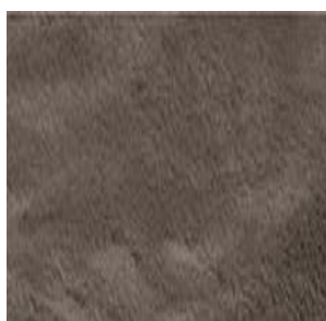
Col. 72 braun